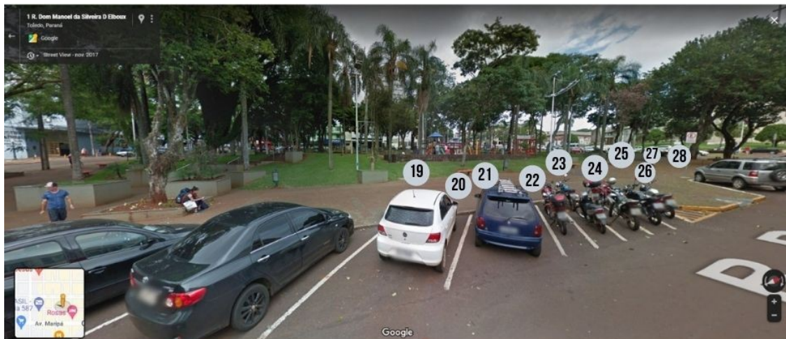
Face da Rua Dom Manuel D'Elboux