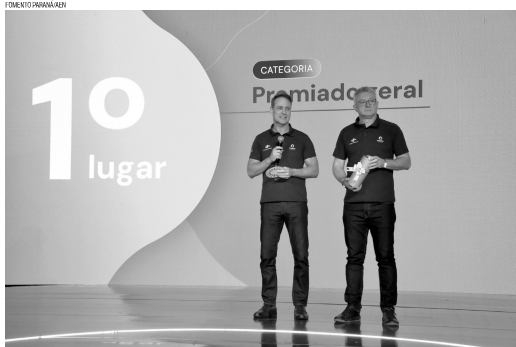
Esse reconhecimento reforça o trabalho de capacitação, uma das prioridades do Sebrae/PR